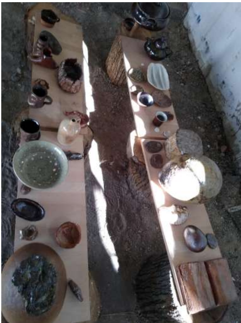
Workshop drevovýpalu, Akadémia umení v Banskej Bystrici, 2019