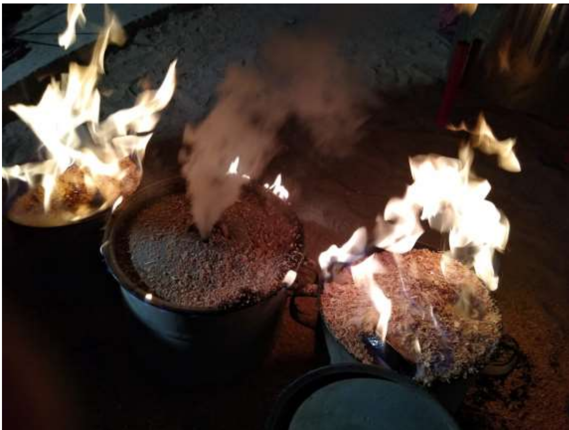
Raku workshop, Akadémia umení v Banskej Bystrici, 2018