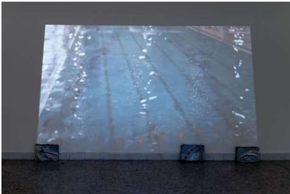
Plaváreň , site-specific inštalácia na výstave Pro Blansko v Galerii města Blanska, 2016