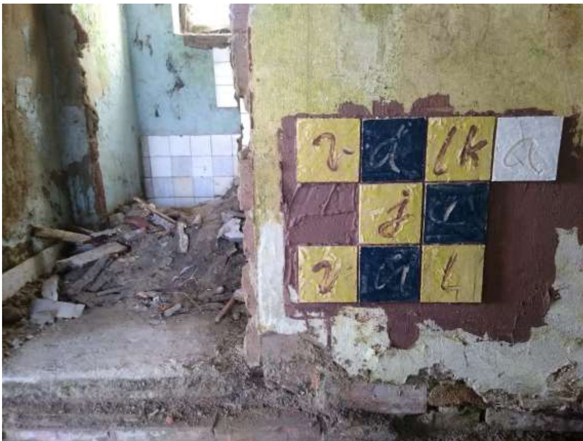
Válka je vôl , miestošpecifická práca pre výstavu Vystavenisko, Somolického 14, Bratislava, 2022