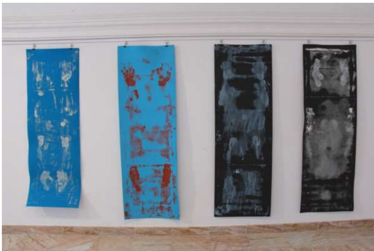
Keep moving , výstava Kto opravuje, Galéria Statua, Bratislava, 2018