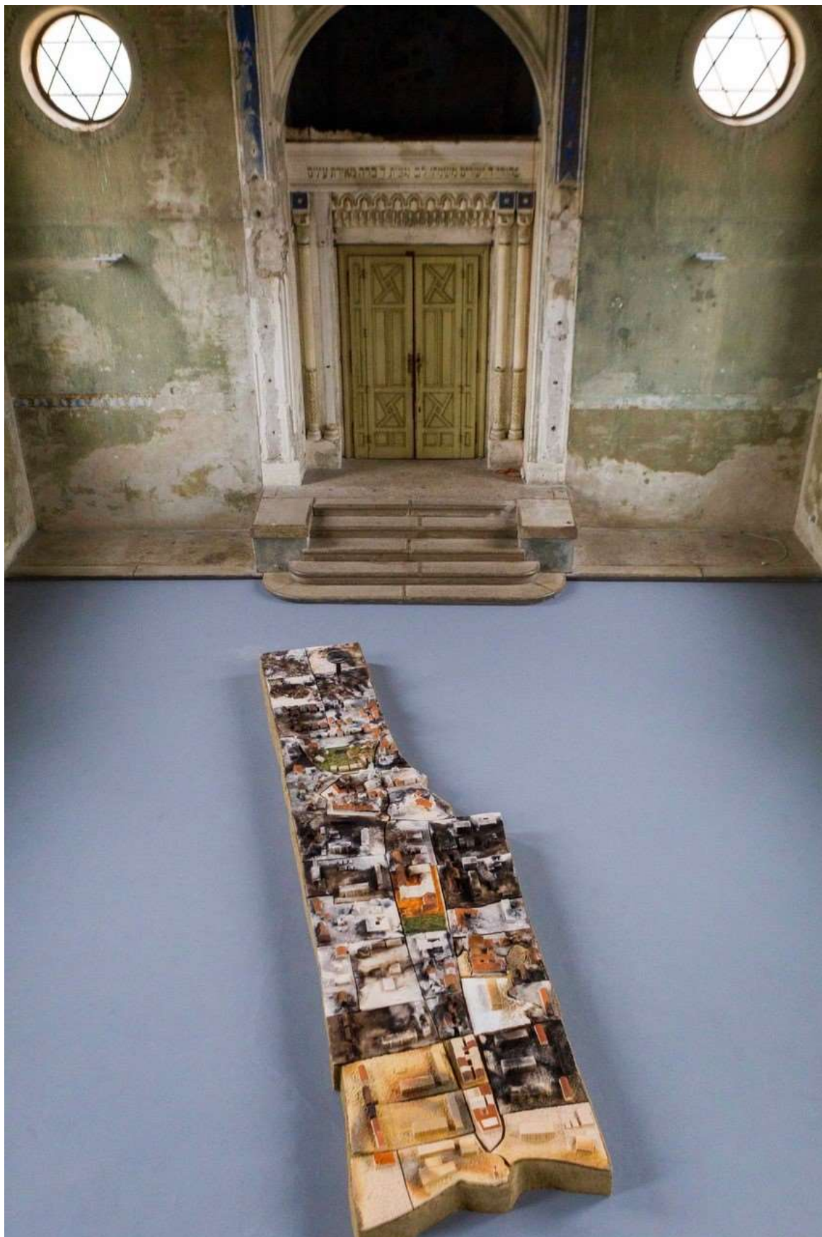
Somorgraphy , inštalácia pre šamorínsku synagógu At Home Gallery, Šamorín, 2019