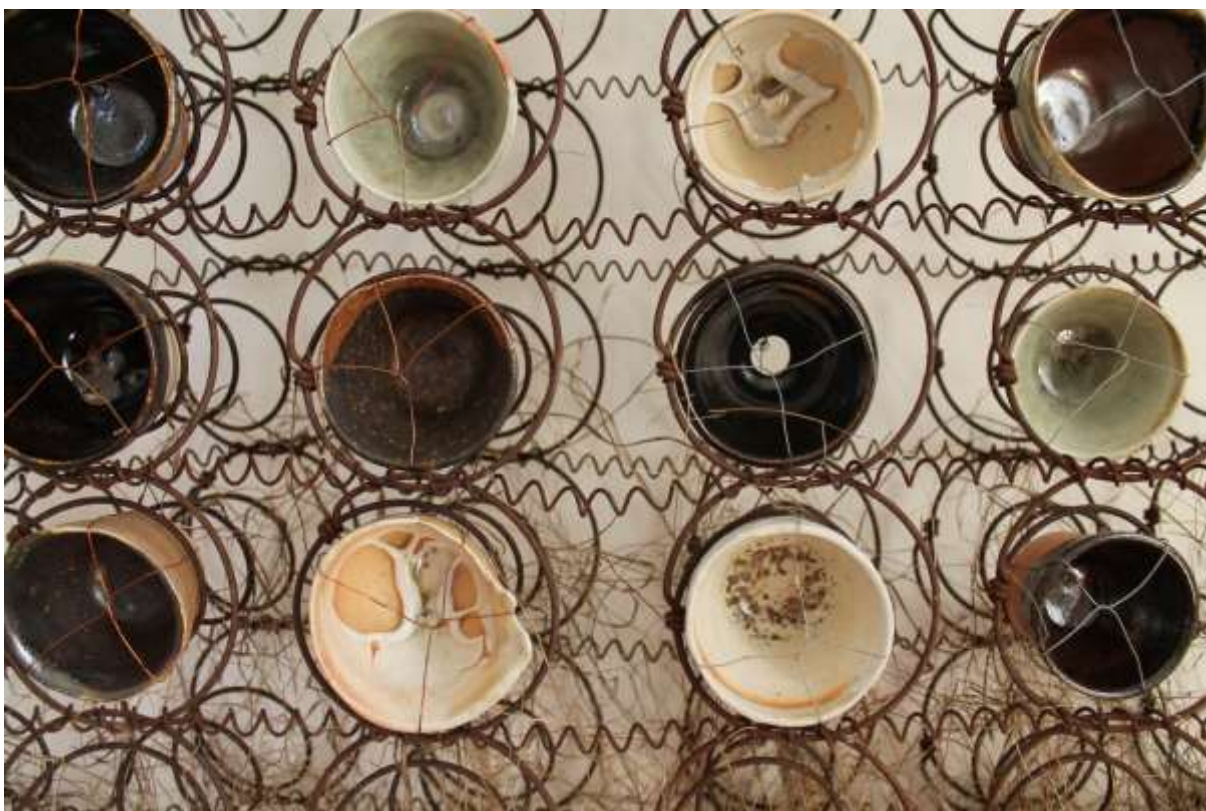
Od stola a od lože, výstava Ako keď letia divé husy, Lazovná 1 Gallery, Banská Bystrica, 2021