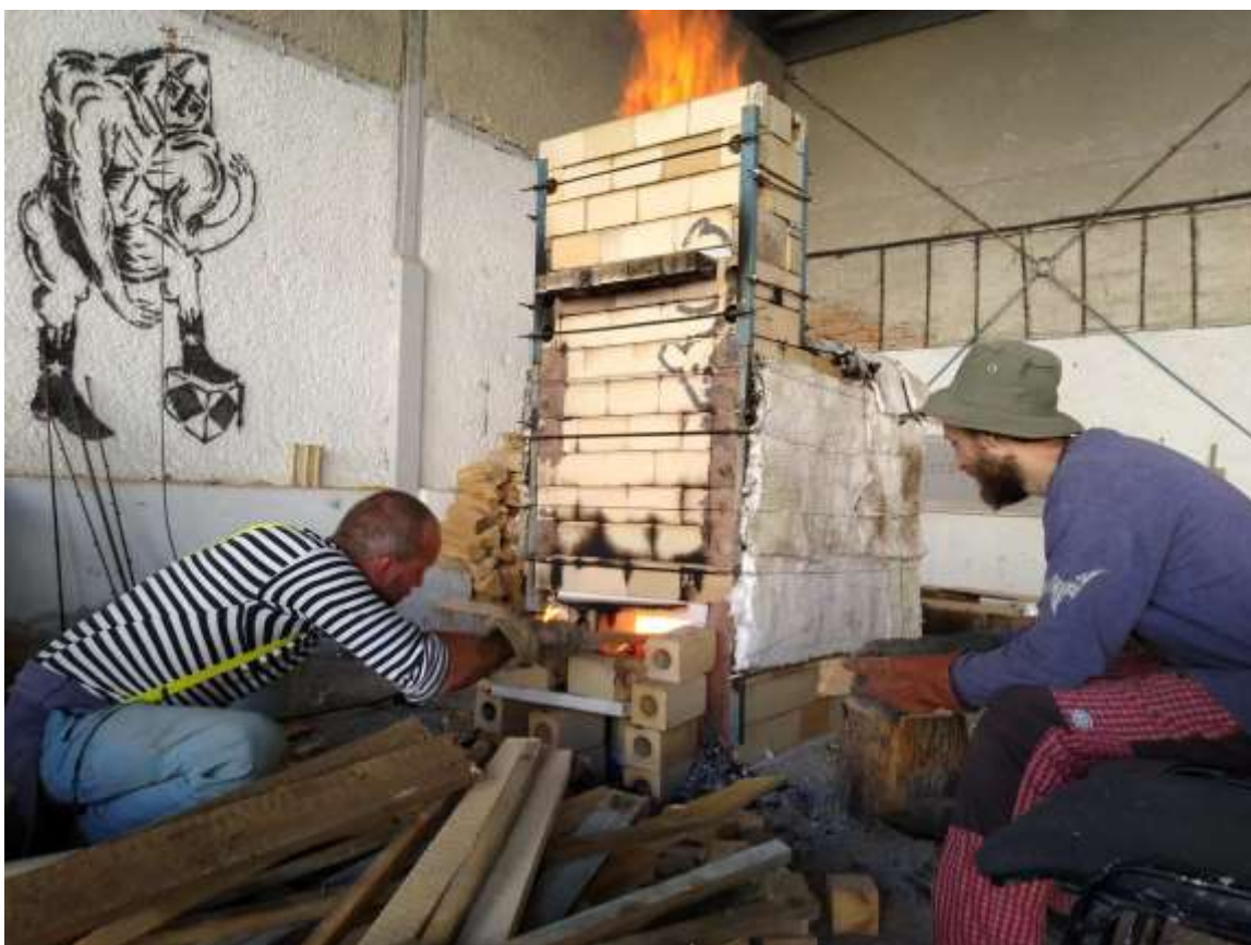
Workshop drevovýpalu, Akadémia umení v Banskej Bystrici, 2019