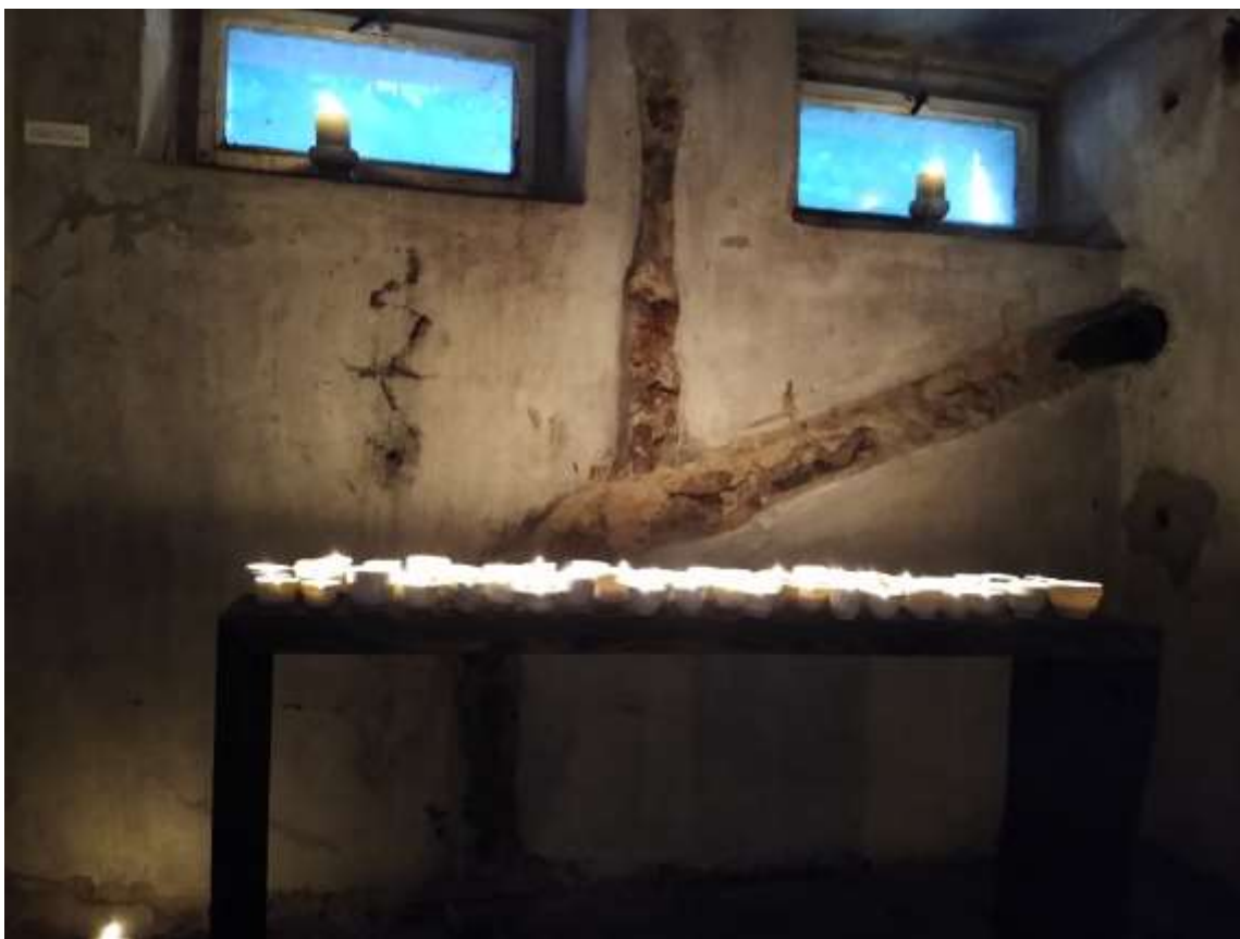
God Bless the Queen , výstava Osvit, Somolického 14, Bratislava, 2022