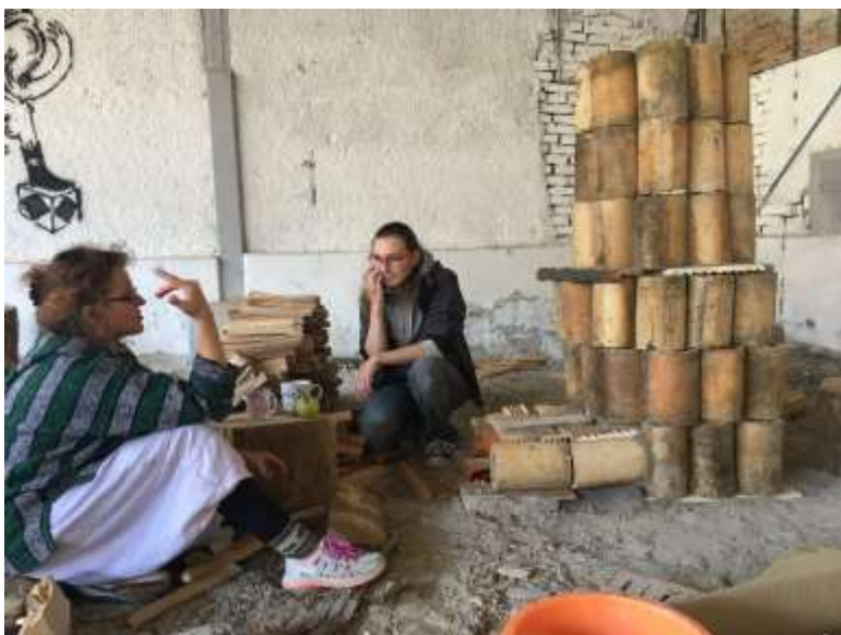
Workshop drevovýpalu, Banská Bystrica, 2018