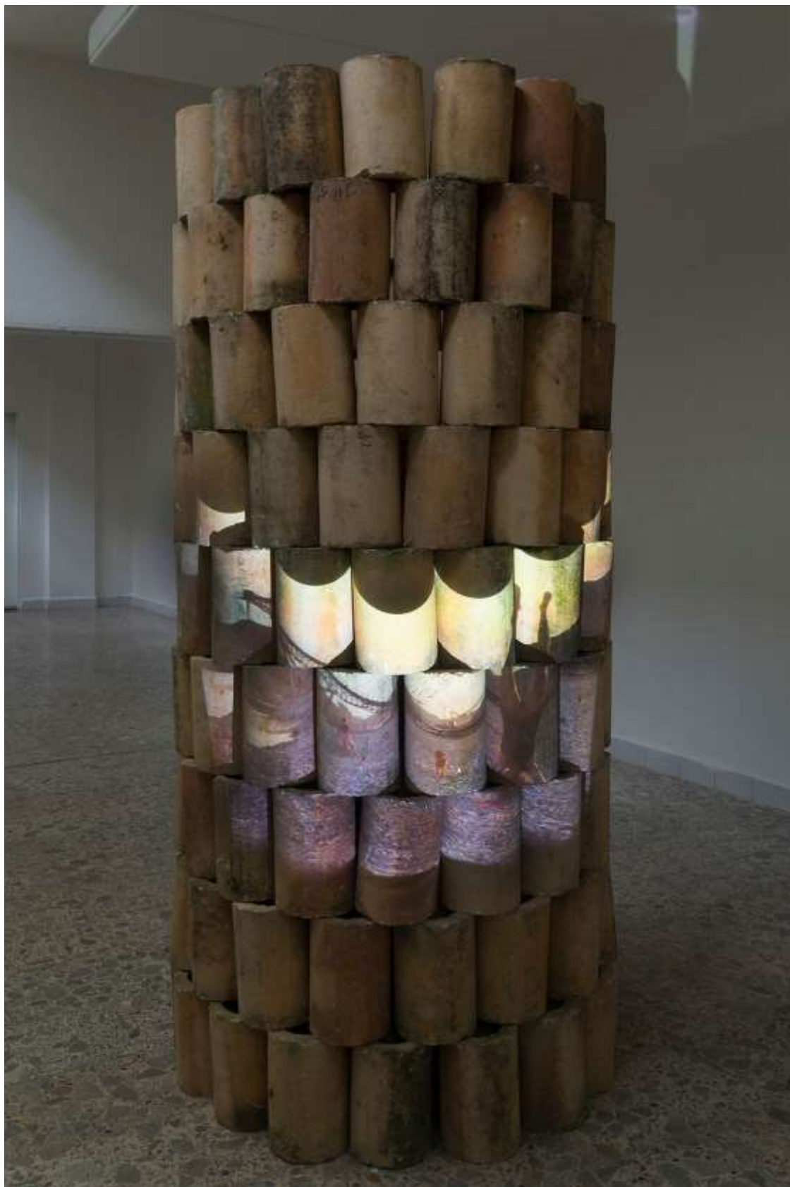
Shirshasana , projekcia na keramické multiply, 2009 na výstave Pro Blansko v Galerii města Blanska, 2016