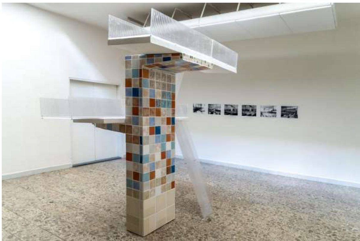
Plaváreň , site-specific inštalácia na výstave Pro Blansko v Galerii města Blanska, 2016