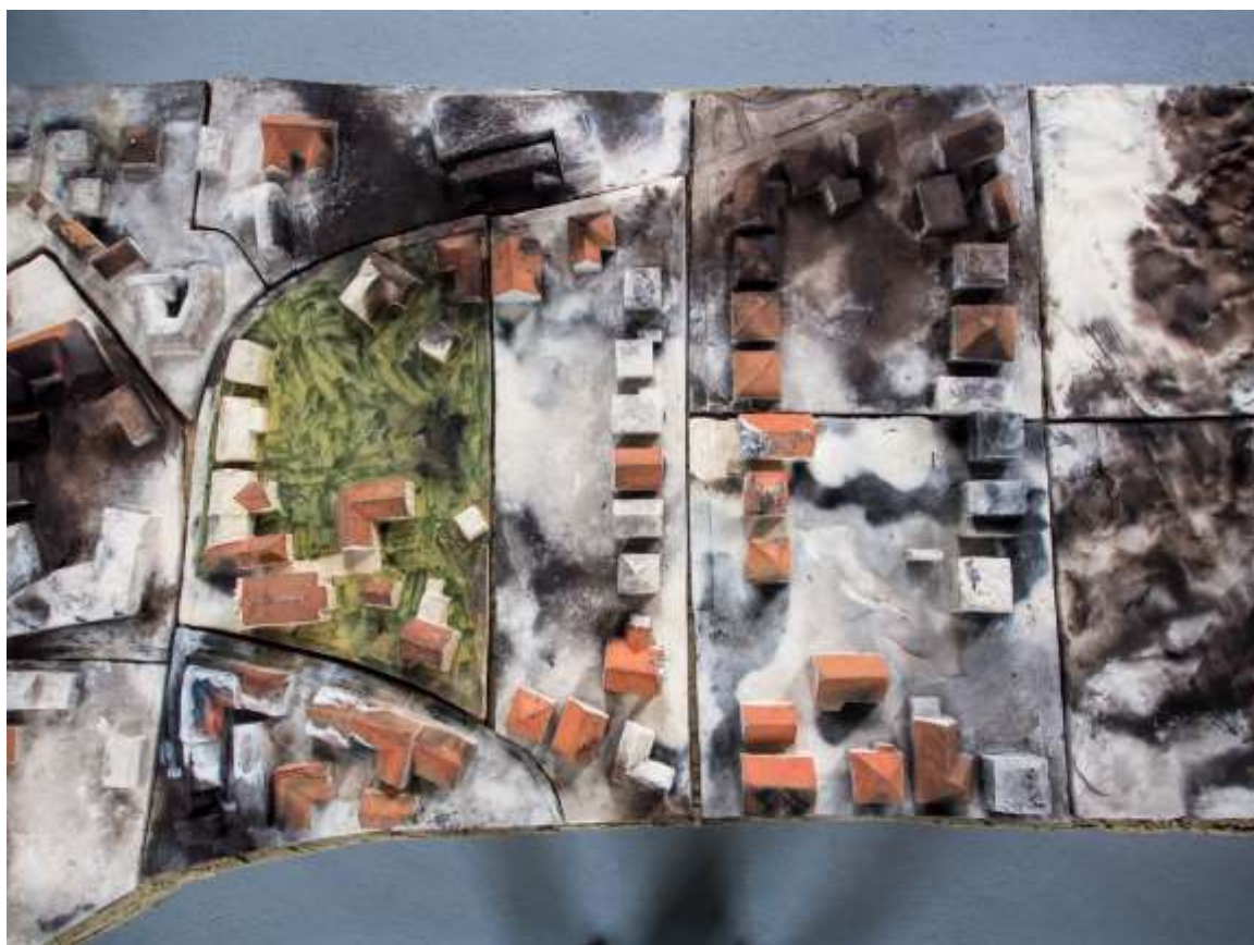
Somorgraphy , 2019