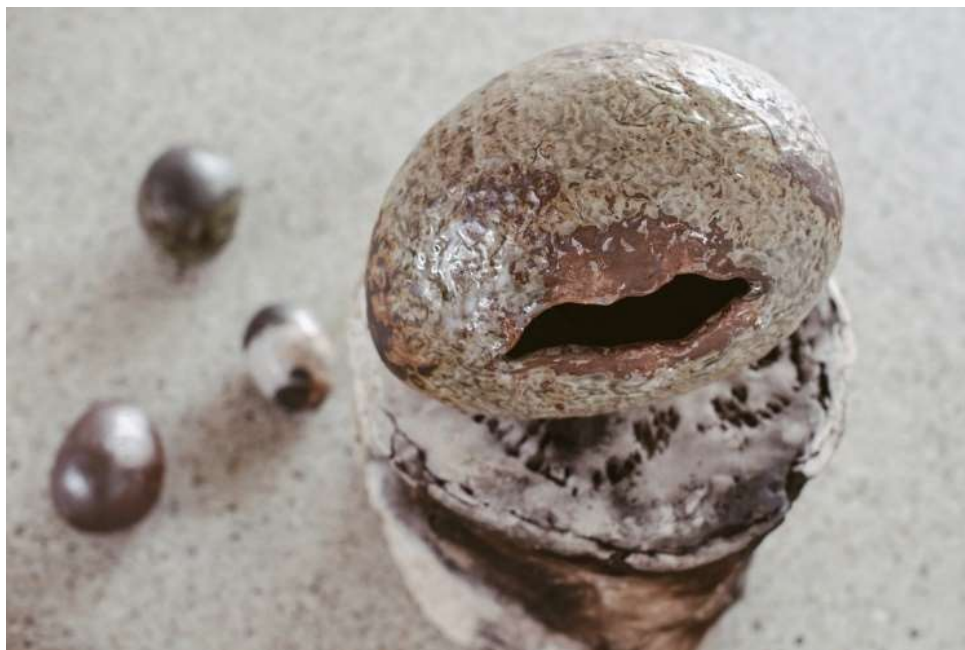
Už sa môžeš znova narodiť (pre Ľ.S.), 2020, výstava Naturistov majestát, Flat Gallery, Piešťany