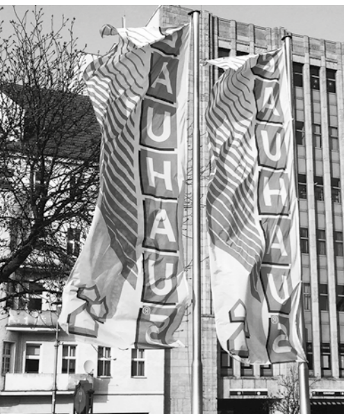
Baumarkt, Berlin-Neukölln