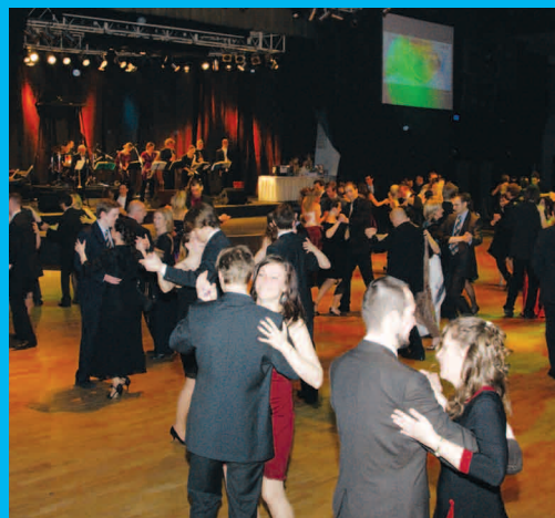
Reprezentativní ples Fakulty podnikatelské / 18. února 2011