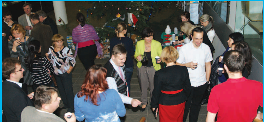
Vánoční strom a punč – sbírka pro děti z pěstounských rodin / prosinec 2011