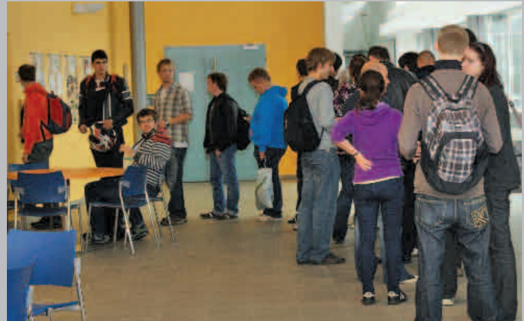
Volby do Akademického senátu / říjen 2011