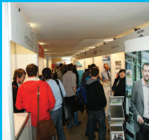
Veletrh pracovních příležitostí 13. dubna 2011