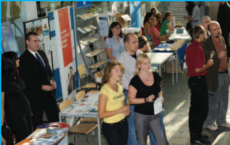
Setkání absolventů na zelené louce / 23. září 2011