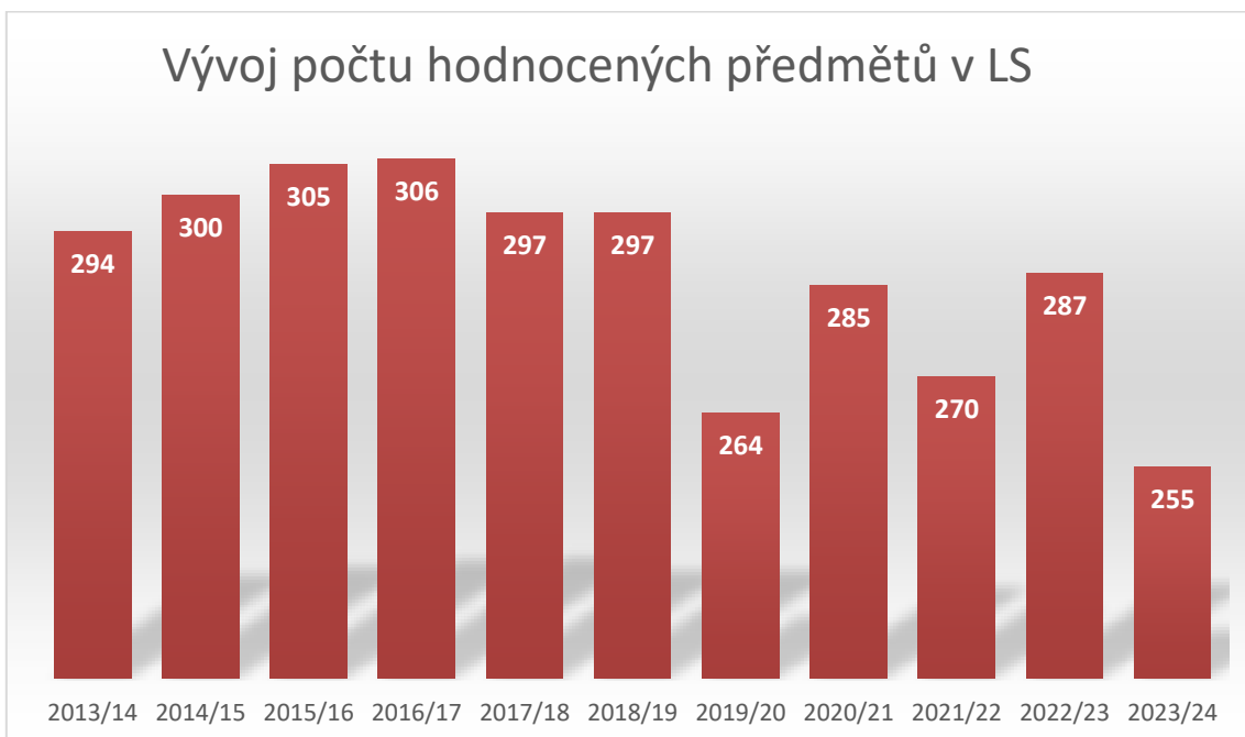
Vývoj počtu hodnocených předmětů v letním semestru v jednotlivých akademických rocích (informace z IS VUT)

Z celkového počtu 571 (611) vyučujících bylo hodnoceno (tj. odpovězeno alespoň na jednu otázku) 559 (603) vyučujících, což je 98 % (99 %). Výše uvedenou podmínku pro zveřejnění výsledků splnilo 166 (260) hodnocených vyučujících, což je 29 % (43 %).