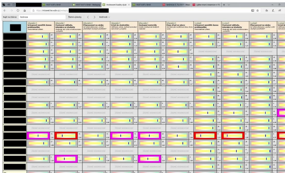
Obr. 3 Zobrazení celkového přehledu vedení fakulty