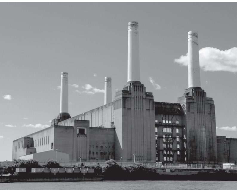
Battersea Power Station, Londýn.

Samozřejmě se vždy také stavěly na věčnost paláce vládců a nic na tom nemění skutečnost, že jim to málokdy vyšlo. Sídlo potom užíval následník, nebo ho naopak nechal rychle zbořit. Podle toho, jakou cestou se dostal k moci a jaký vztah měl ke svému předchůdci. Hrady královských dynastií mají pochopitelně jiné osudy a jinou polohu v čase než paláce vítězných guerillových vůdců.