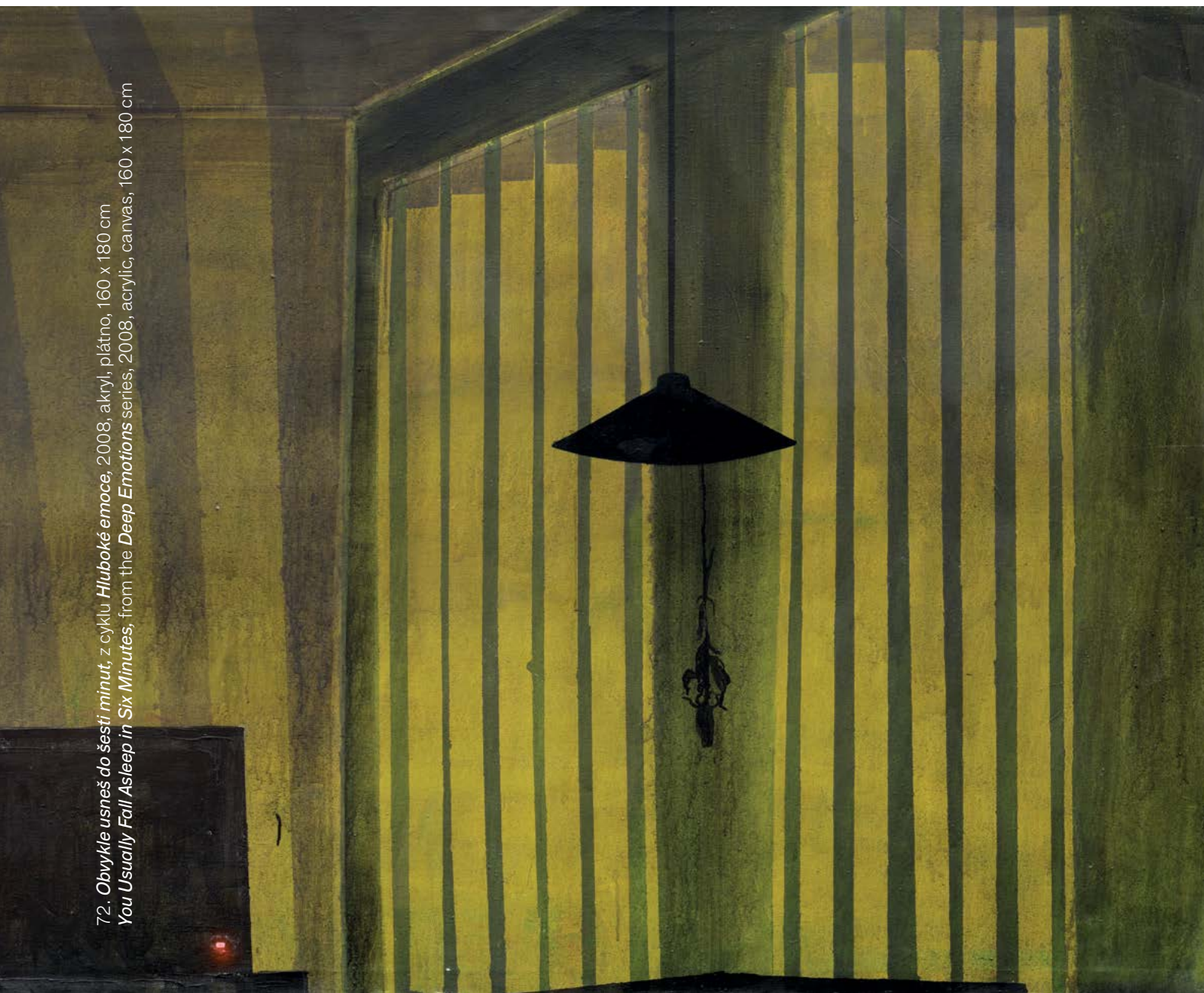
72. Obvykle usneš do šesti minut, z cyklu Hluboké emoce , 2008, akryl, plátno, 160 x 180 cm You Usually Fall Asleep in Six Minutes , from the Deep Emotions series , 2008, acrylic, canvas, 160 x 180 cm