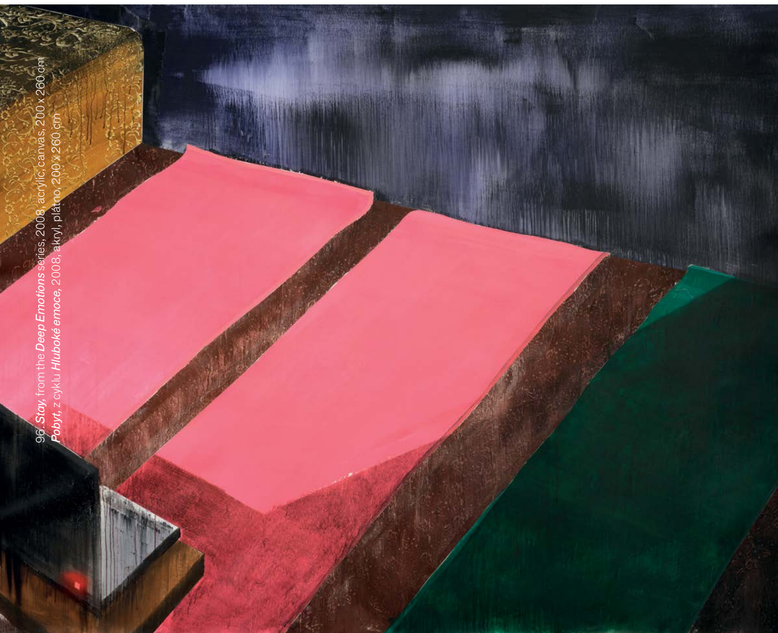
Text: Kateřina Štroblová

E-X-I-T. Four letters in a golden square, each in one corner of the canvas. Between them the flag of Great Britain, placed vertically and supplemented with a golden, five-point star of the St. George's cross. Free spaces at top, at bottom, on the right and the left side of the canvas are filled with the numerals 2, 1, 6, and 0, read clockwise.