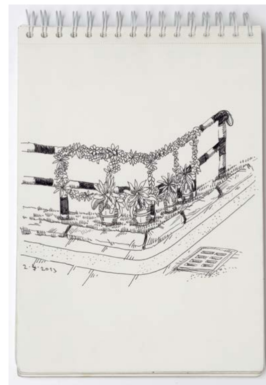
10. Kresba 2. 4. 2013 , gelové pero, papír, 28 x 21 cm Drawing 2. 4. 2013 , gel pen, paper, 28 x 21 cm