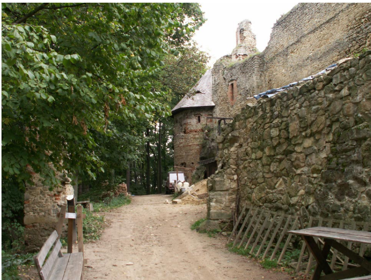
Obr. 1 Hrad Cimburk – vstup do hradu, v pozadí upravení severovýchodní bašta (foto Adam Guzdek, 2006)