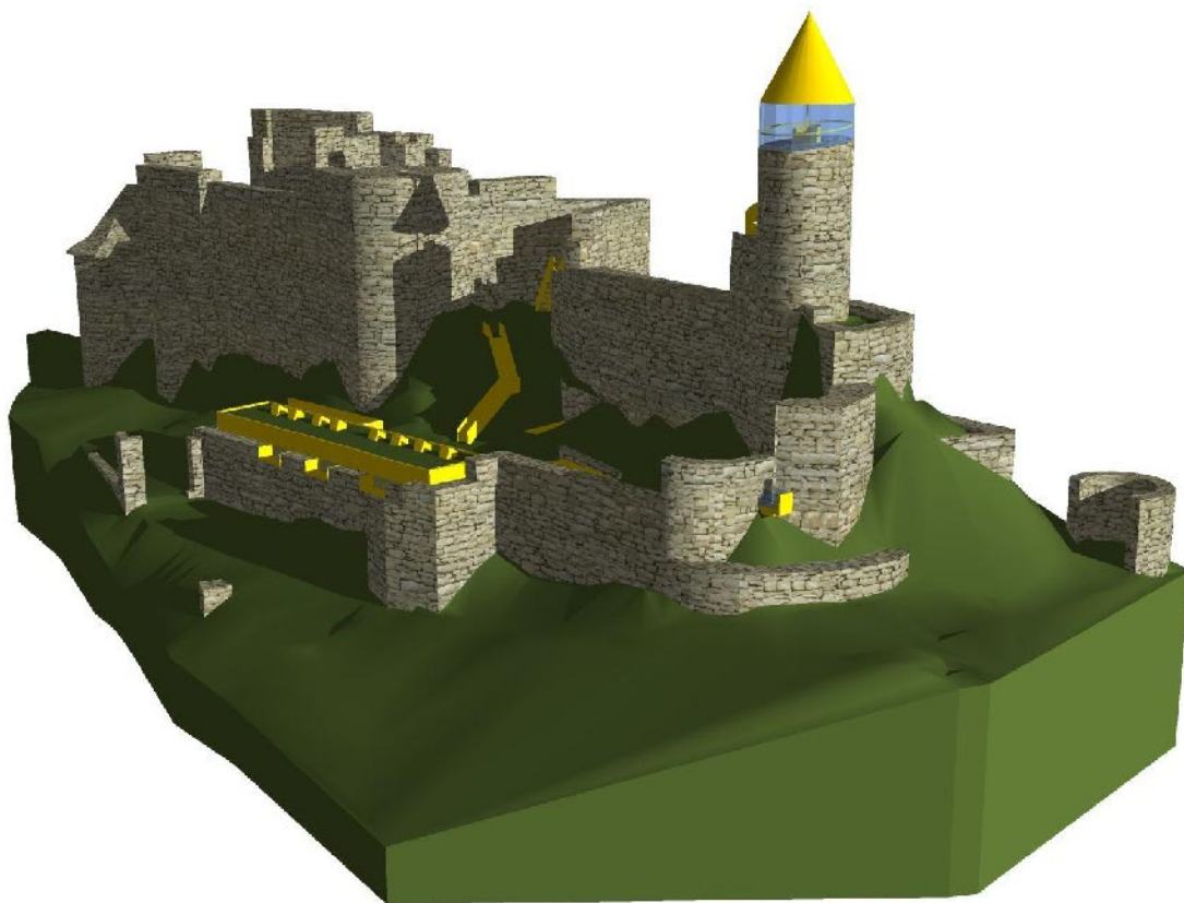
Obr.2 Vizualizace konceptu stavebních úprav hradu (ateliérová práce, 3. roč., A. Guzdek)

V této definitivní podobě byla koncepce stabilizace a revitalizace hradu rámcově schválena odborným orgánem památkové péče v Brně v roce 2002. Její realizace byla rozdělena do etap podle toho, jakým způsobem se dařilo zajišťovat její nezbytné podmínky, zejména předprojektovou přípravu, projekci a finance. Rozdělení do etap a tím i stálý přístup na hrad má také pozitivní vliv na návštěvnost památky.