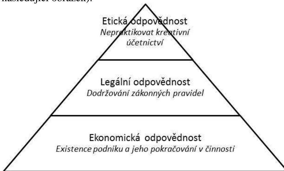
Obrázek 1 Pyramida účetní odpovědnosti firem

Podobně jako byla sestavena pyramida společenské odpovědnosti firem lze i jednání v oblasti účetnictví zahrnout do podobné pyramidy účetní odpovědnosti firem. (viz následující obrázek).